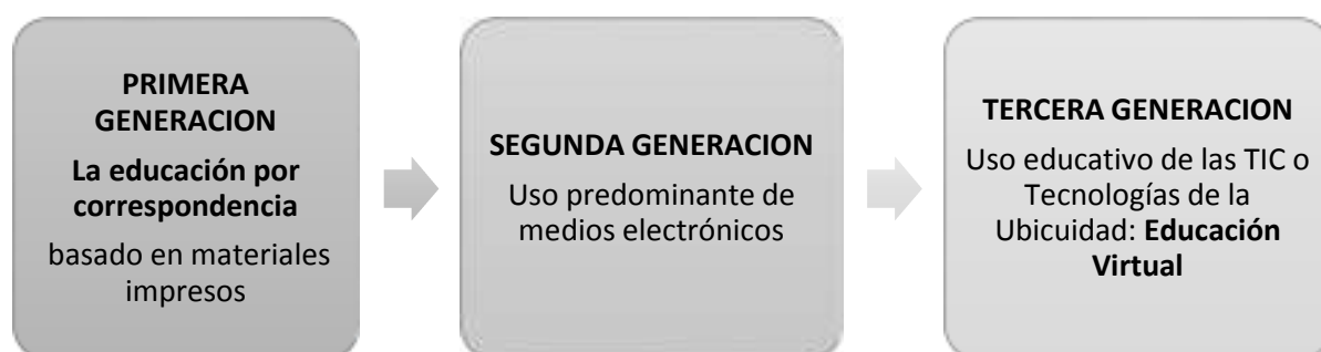
Figura 1. Evolución de la educación no presencial.